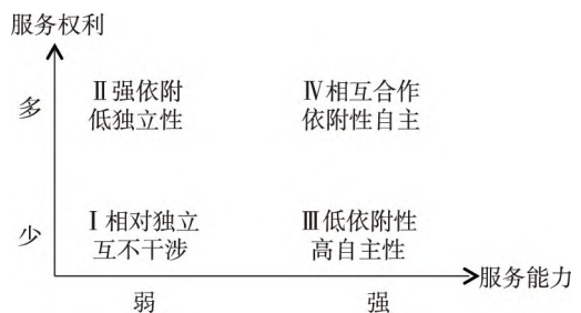
图 2 农民合作社服务权能拓展路径

总体而言,合作社的服务权能会随其与政府、社员以及其他利益主体互动的情况而发生变化,进而导致合作社出现不同的发展动态。根据不同状态下合作社服务权利与服务能力的匹配情况,本文尝试划分出如图 2 所示的四类组织服务权能拓展类型:第 I 类是农民合作社服务权能较弱的状态,其服务能力弱、服务权利资源较少。组织虽实现了服务能力与服务权利间的匹配,但是低水平的匹配,如现实中的空壳合作社便是此类型的组织。第 II 类则是农民合作社处于强依附于地方政府组织的状态,此时期其拥有的服务权利资源超过了其自身的服务能力水平。这种类型的组织在现实中多对应那些“假合作社”“挂名社会组织”,其建立目的主要是利用合作社的身份来套取国家资源。第 III 类则是农民合作社的服务能力较强,其所能够提供的服务项目要超过政府给其配置的服务权利资源,此时期农民合作社拥有较强的独立性与自主性,下文所考察的先锋联社在很长一段时间内便是在此状态下发展。第 II 类、第 III 类代表了农民合作社由第 I 状态可能会出现两种方向,即其中涉及了组织选择追求自身独立性或依附于地方政府的两大发展方向。二者均处于组织服务权能发展的不稳定状态,都需要通过进一步发展以推动服务能力与服务权利的匹配。第 IV 类型则是农民合作社服务权能实现有效拓展的稳定发展状态,此时期其服务能力与服务权利相对匹配,在一定程度上依附于地方政府的同时也充分保留着自身的独立性与自主性以实现可持续发展,这亦是当前农民合作社迈向综合化发展相对理想的发展状态。需要点明的是,本文建构此四类组织状态的理想类型,主要是尝试将合作社、地方政府以及其他相关主体都假定为理性行动主体,并结合当前的政治社会环境,进而对农民合作社在拓展自身服务权能过程中所面临的困境和实践策略进行深入考察。